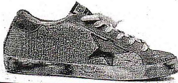
Una scarpa Golden Goose

di sviluppo con una way out al 2017, non volevo lasciare questo percorso a metà. Da qui ai prossimi anni continueremo anche a investire sul wholesale (il marchio conta circa 600 clienti nel mondo, ndr), in particolare su Giappone e Usa». E proprio alla volontà di investire sul mercato a stelle e strisce risponde la decisione di partire, con la cru-